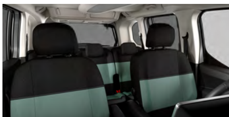
LÁTKA MICA GREEN