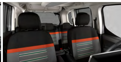
PACK XTR S POŤAHOM WILD GREEN (OGFR)