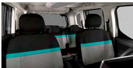
LÁTKA METROPOLITAN GREY (OFFT)