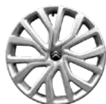
OZDOBNÝ KRYT 16" TWIRL (s čiernym stredom)