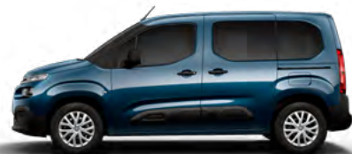
MODRÁ NUIT (M) (Nie je možné objednať pre LIVE PACK)