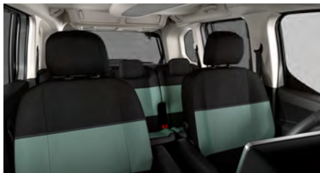
LÁTKA MICA GREEN