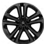
DISK Z ĽAHKEJ ZLIATINY 16" STARLIT