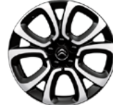
DISK Z ĽAHKEJ ZLIATINY 17" SPIN