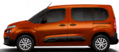
HNEDÁ CUPRITE (M) (Nie je možné objednať pre LIVE PACK)

M – metalická farba; N – nemetalická farba