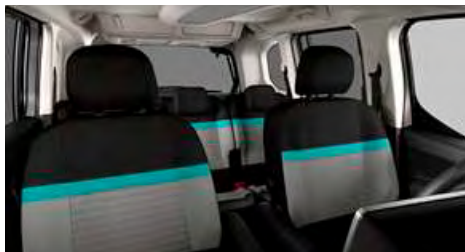
LÁTKA METROPOLITAN GREY (OFFT)