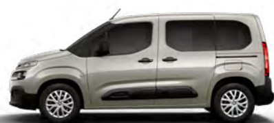
BÉŽOVÁ SABLE (M) (Nie je možné objednať pre LIVE PACK)