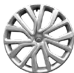
OZDOBNÝ KRYT 16" TWIRL