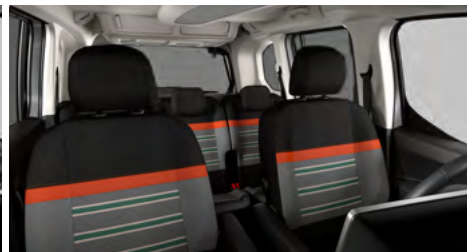
PACK XTR S POŤAHOM WILD GREEN (OGFR)