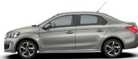
Běžová SABLE (M) *

M – metalická farba, N – nemetalická farba