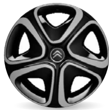
3D Okrasný kryt 16"