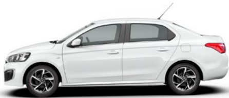
Biela BANQUISE (N)