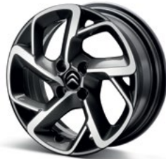
SAN DIEGO Hliníkové disky 16"