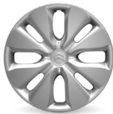
ASTÉRODEA Okrasný kryt 15"