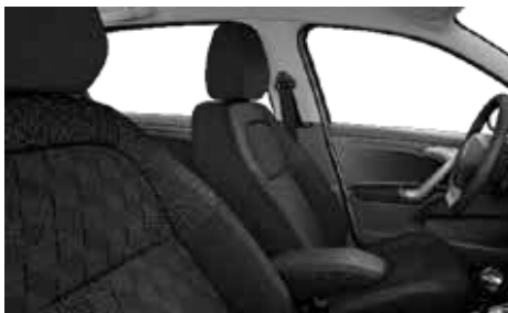
LÁTKA WAXE MISTRAL