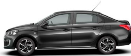
Čierna ONYX (N)