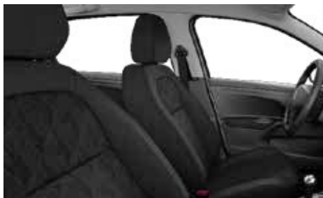
LÁTKA BIRDY MISTRAL