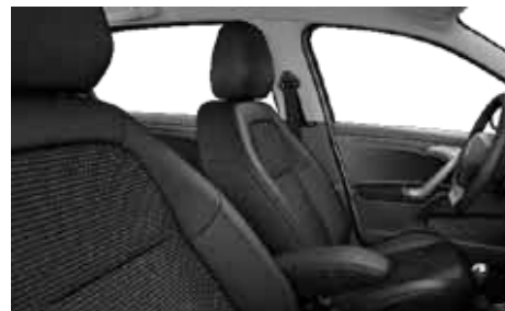
MIX KOŽA/LÁTKA CLAUDIA