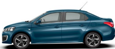
Modrá NUIT (M) *