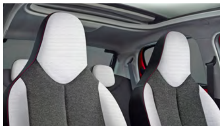
LÁTKA CURIBITA TRITON URBAN RIDE