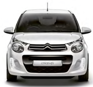
Biela OURAL nemetalická