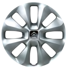
COMET okrasný kryt 15"