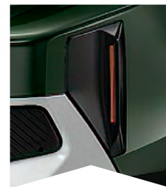
PRE ZELENÚ MONTANA