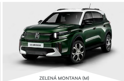
ZELENÁ MONTANA (M)

(M) – metalická farba karosérie, (N) – nemetalická farba