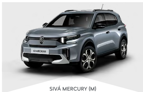
SIVÁ MERCURY (M)