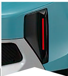
PRE MODRÚ MONTE CARLO