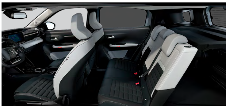
Sedadlá Citroën Advanced Comfort Palubná doska a panely dverí s dekórom Siderite