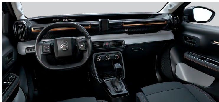
INTERIÉR URBAN BRONZE : LÁTKOVÝ POŤAH ČIERNY (BYFH)