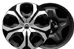
OKRASNÝ KRYT SYLVANITE 17"