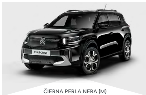
ČIERNÁ PERLA NERA (M)