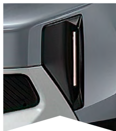
PRE SIVÚ MERCURY