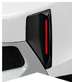
PRE BIELU BANQUISE