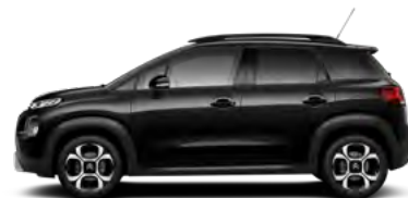
Čierna PERLA NERA (M)