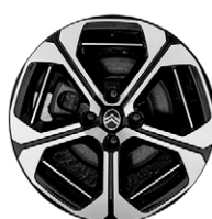
DISK Z LAHKEJ ZLIATINY ARAGONITE 17"