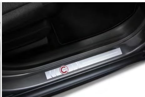
Prah dverí s motívom limitovanej edície C-SERIES