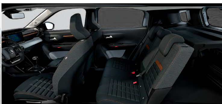
Palubná doska a panely dverí s bronzovým dekórom Sedadlá Advanced Comfort