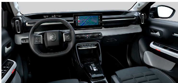
INTERIÉR METROPOLITAN GREY : LÁTKOVÝ POŤAH ČIERNY HELLO / SIVÝ TEP POŤAH (BXFV)