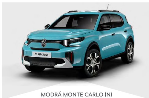
MODRÁ MONTE CARLO (N)