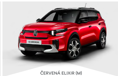
ČERVENÁ ELIXIR (M)