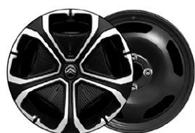
OKRASNÝ KRYT TITANITE 16"