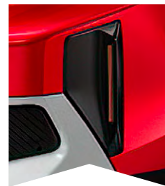
PRE ČERVENÚ ELIXIR