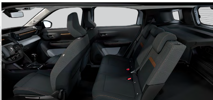
Palubná doska a panely dverí s bronzovým dekórom