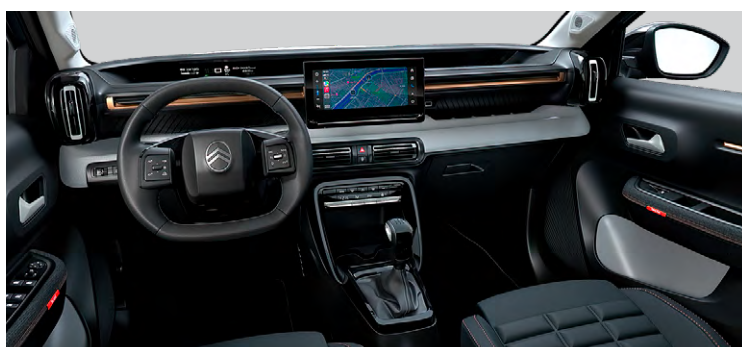
INTERIÉR URBAN BRONZE : LÁTKOVÝ POŤAH ČIERNY (BYFH)