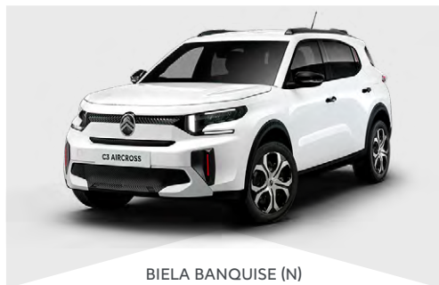
BIELA BANQUISE (N)