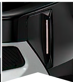
PRE ČIERNU PERLA NERA