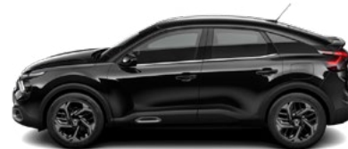
ČIERNÁ OBSIDIEN (M)