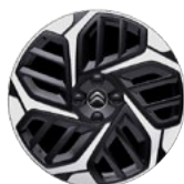
DISK Z LAHKEJ ZLIATINY 18" CAMELIA DIAMANTÉE