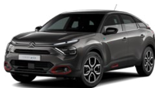
PACK COLOR ANODISED RED