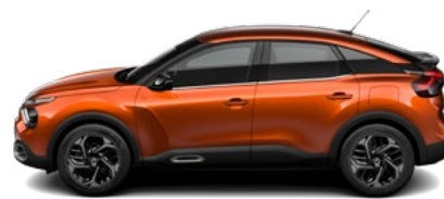
HNEDÁ CAMEL (M)