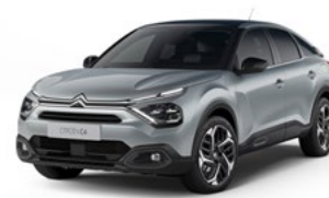
PACK COLOR VAPOR GREY