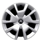
OKRASNÝ KRYT 16" SPRING