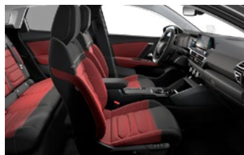
INTERIÉR HYPE RED