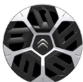
OKRASNÝ KRYT 18" AEROTECH