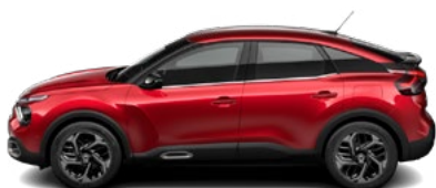
ČERVENÁ ELIXIR (P)

(M) – metalická farba karosérie, (P) – perletová farba