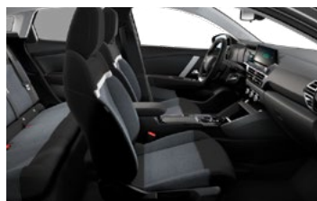
ŠTANDARDNÝ INTERIÉR (PRE LIVE PACK A FEEL)