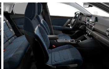
INTERIÉR METROPOLITAN BLUE