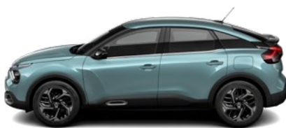
MODRÁ ICELAND (M)