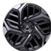
DISK Z LAHKEJ ZLIATINY 18" CAMELIA