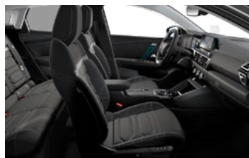
INTERIÉR HYPE BLACK