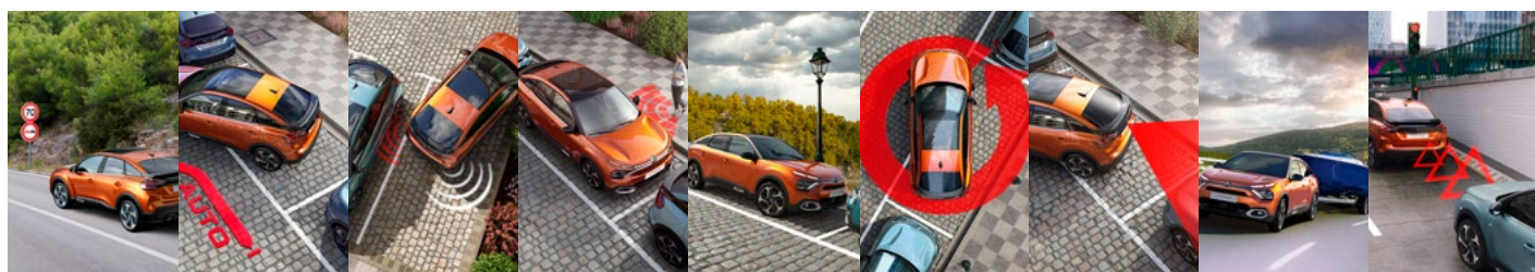
ČÍTANIE DOPRAVNÝCH ZNAČIEK A RÝCHLOSTNÝCH OBMEDZENÍ