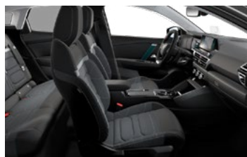
INTERIÉR URBAN GREY (V SÉRII PRE FEEL PACK)