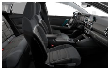
INTERIÉR METROPOLITAN GREY (V SÉRII PRE SHINE)