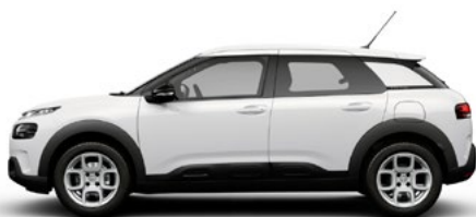
Biela BANQUISE (N)