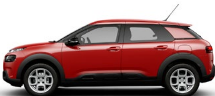
Červená ADEN (N)