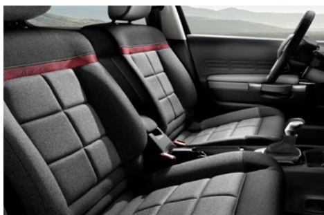
INTERIÉR C-SERIES s červeným štepaním a prvkom v tej istej farbe