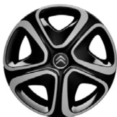
DISK Z ĽAHKEJ ZLIATINY 16" STEEL & STYLE