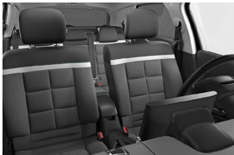
INTERIÉR WILD GREY