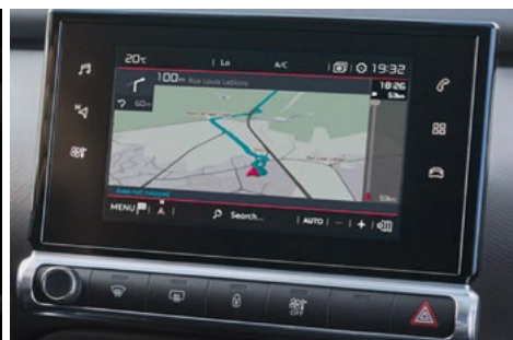
Dotykový 7" multifunkčný farebný displej