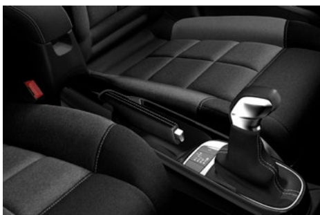
Sedadlá ADVANCED COMFORT