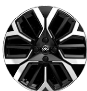
MAX DISK Z LAHKEJ ZLIATINY 18" AMBER