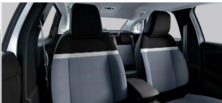
LÁTKOVÉ ČALÚNENIE KOMBINÁCIA SIVÁ/ČIERNA (PRE YOU)