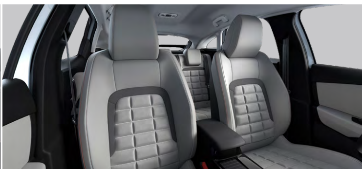
INTERIÉR ALCANTARA GREY (ZA PRÍPLATOK PRE MAX)

Alcantara sivá / sivý TEP poťah — Sedadlá Advanced Comfort — Sedadlo vodiča elektricky ovládané 4 smermi s bedrovým nastavením (elektrickým), s masážnou funkciou + mechanické pozdĺžne nastavenie — Sedadlo spolujazdca s bedrovým nastavením (elektrickým) a s masážnou funkciou — Odkladacie vrecká na zadnej strane predných sedadiel