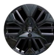
ZA PRÍPLATOK DISK Z LAHKEJ ZLIATINY 18" BLACK AMBER