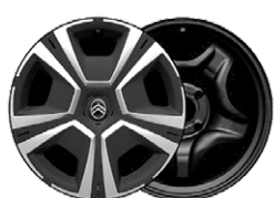
YOU OKRASNÝ KRYT 16" STEEL & DESIGN