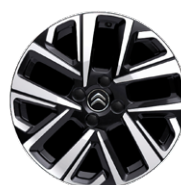
ZA PRÍPLATOK DISK Z LAHKEJ ZLIATINY 17" MARIEM