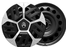
PLUS OKRASNÝ KRYT 18" AEROTECH