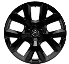
Disk z ľahkej zliatiny ART ČIERNY, 19"