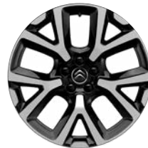
Disk z ľahkej zliatiny ART diamantée, 19"