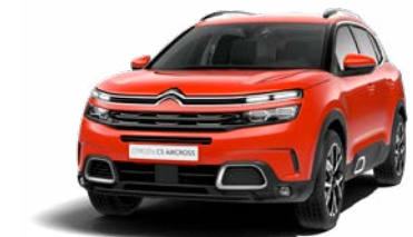
Pack Color Silver (strieboiná)