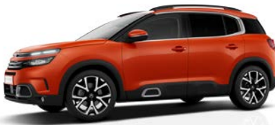
Červená Volcano (M)