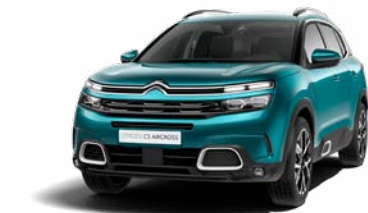
Pack Color White (biela)