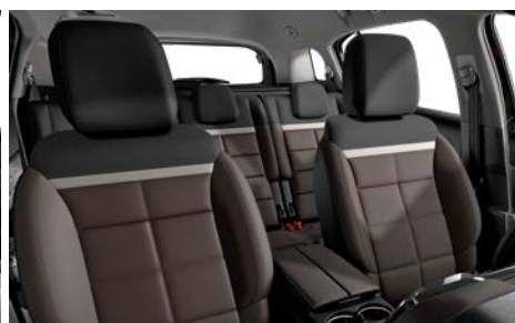
Mix koža NAPPA hnedá – látka hnedá / HYPE hnedá