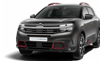
Pack Color Deep Red (červená)