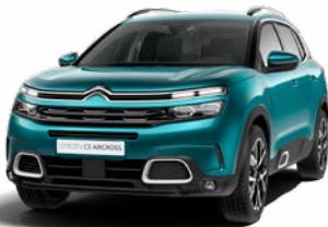
Pack Color White (biela)