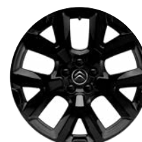
Disk z ľahkej zliatiny ART ČIERNY, 19"