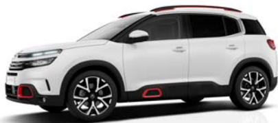
Biela Nacré (P)