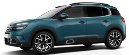
Modrá Tijuca (M)