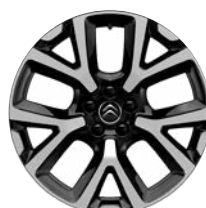
Disk z ľahkej zliatiny ART diamantée, 19"