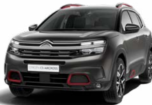
Pack Color Deep Red (červená)