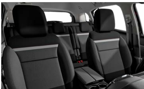
Látka SILICA sivá (v sérii pre LIVE PACK a FEEL)