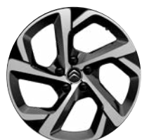
Disk z ľahkej zliatiny SWIRL diamantée, 18"