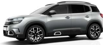
Sivá Artense (M)