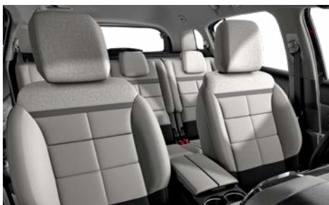
Mix koža GRAINE sivá – sivá látka / METROPOLITAN béžový