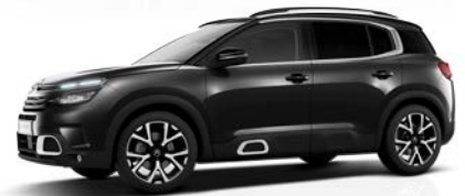
Čierna Perla Nera (M)