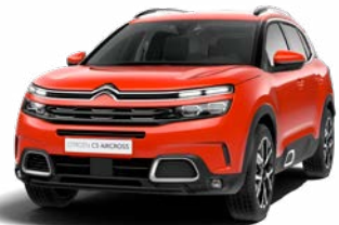
Pack Color Silver (strieboiná)