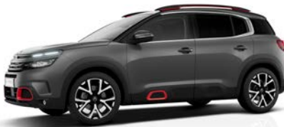
Sivá Platinium (M)