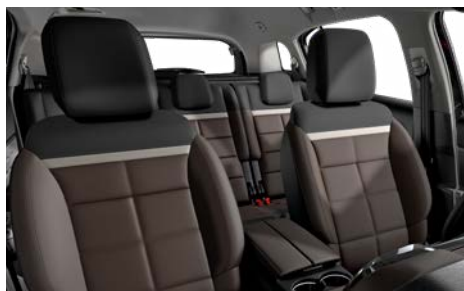
Mix koža NAPPA hnedá – látka hnedá / HYPE hnedá