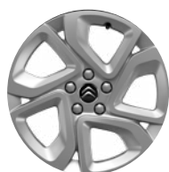
Disk z ľahkej zliatiny ELLIPSE, 17"