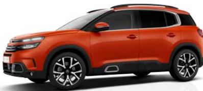
Červená Volcano (M)