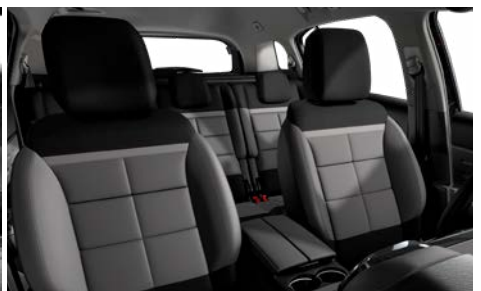
Mix koža GRAINE – grafitová látka / METROPOLITAN sivý