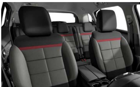
Mix látka s efektom kože (TEP) čierna + látka Stone sivá