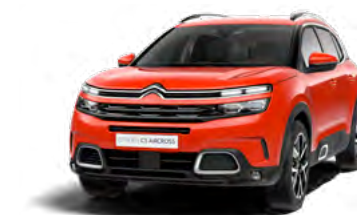
Pack Color Silver (strieborná)