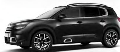
Čierna Perla Nera (M)