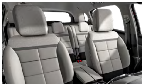
Mix koža GRAINE sivá – sivá látka / METROPOLITAN béžový