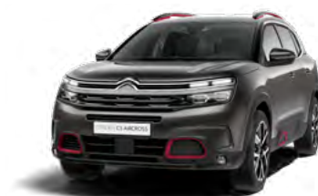
Pack Color Deep Red (červená)