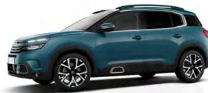
Modrá Tijuca (M)