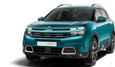
Pack Color White (biela)