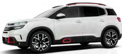
Bielá Nacré (P)