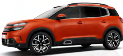
Červená Volcano (M)