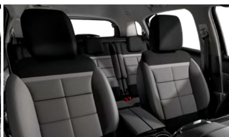
Mix koža GRAINE – grafitová látka / METROPOLITAN sivý