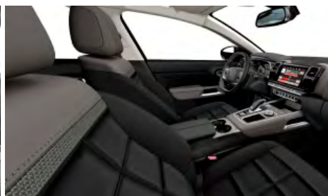
Mix koža NAPPA čierna – látka (TEP) sivá / interiér HYPE čierny