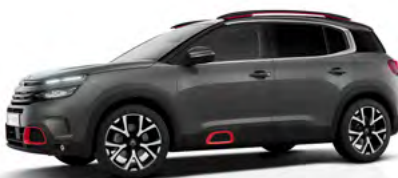
Sivá Platinum (M)