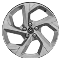
Disk z ľahkej zliatiny SWIRL, 18"