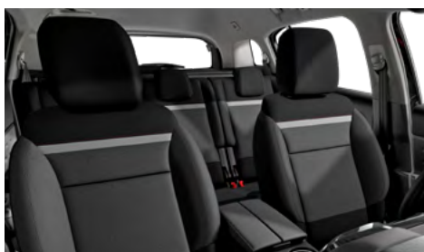
Látka SILICA sivá (v sérii pre FEEL)