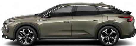
SIVÁ AMAZONITE (M)