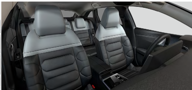
INTERIÉR METROPOLITAN GREY (v sérii pre PLUS)