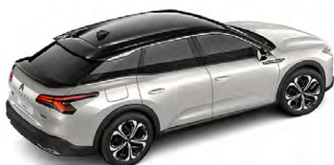
BIELA NACRÉ (P)