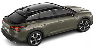
SIVÁ AMAZONITE (M)