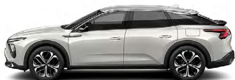
BIELA NACRÉ (P)