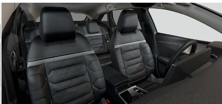
INTERIÉR HYPE BLACK (v sérii pre MAX)