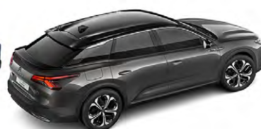
SIVÁ PLATINUM (M)

(M) – metalická farba karosérie, (P) – perleťová farba