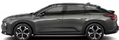
SIVÁ PLATINUM (M)