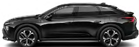
ČIERNA PERLA NERA (M)