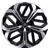
DISK Z ĽAHKEJ ZLIATINY 19" AERO-X BLACK DIAMOND