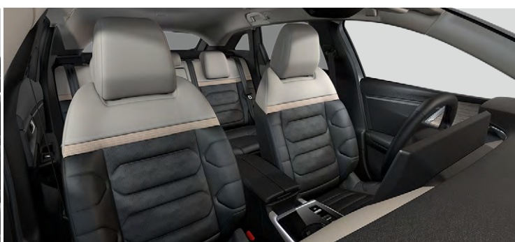
INTERIÉR HYPE ADAMANTIUM