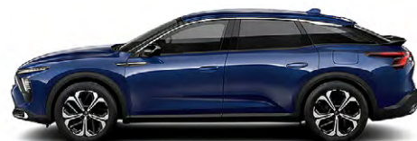
MODRÁ ECLIPSE (M)