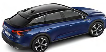
MODRÁ ECLIPSE (M)