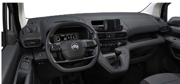
Sivá / čierna látka CURITIBA + BRASILIA