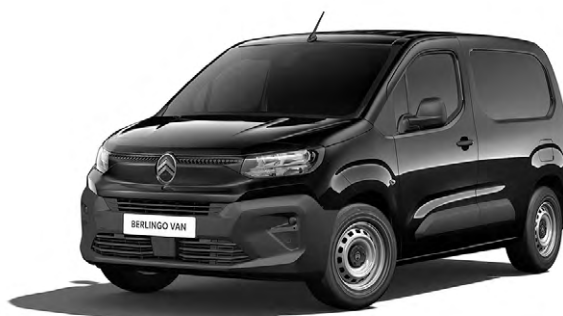
ČIERNÁ PERLA NERA

● – poťah bez príplatku; ○ – opcia. (1) farba karosérie bez príplatku; (2) voliteľná farba karosérie za príplatok; (3) CITROËN ADVANCED COMFORT je voliteľný poťah za príplatok.