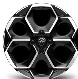
DISK Z LAHKEJ ZLIATINY ATACAMITE 17"