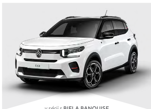
v sérii s BIELA BANQUISE