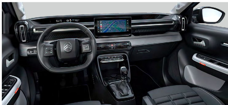
INTERIÉR METROPOLITAN GREY (NHFX)