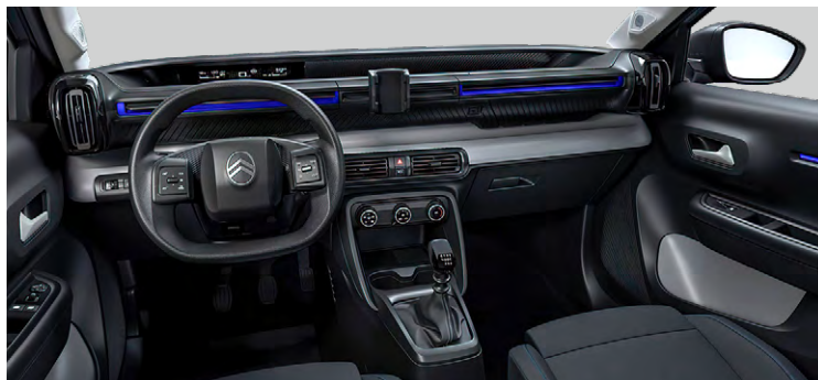
LÁTKOVÝ POŤAH ČIERNOSIVÝ (NAFX)