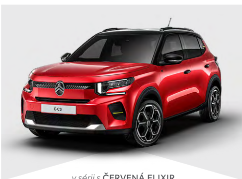
v sérii s ČERVENÁ ELIXIR