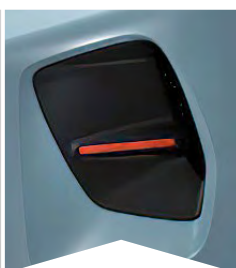
PRE MODRÚ MONTE CARLO