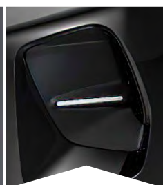
PRE ČIERNU PERLA NERA