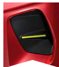
PRE ČERVENÚ ELEXIR