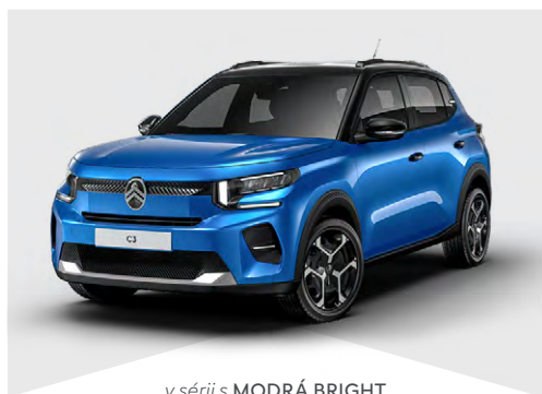
v sérii s MODRÁ BRIGHT