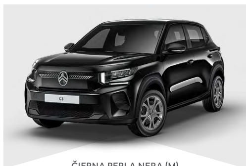
ČIERNÁ PERLA NERA (M)