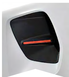
PRE BIELU BANQUISE