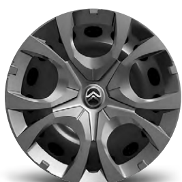
OKRASNÝ KRYT PYRITE 16"