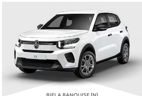
BIELA BANQUISE (N)