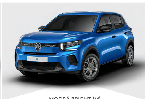
MODRÁ BRIGHT (M)

(M) – metalická farba karosérie, (N) – nemetalická farba