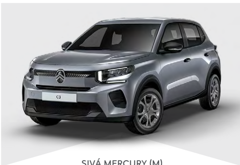
SIVÁ MERCURY (M)