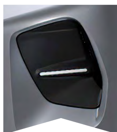
PRE SIVÚ MERCURY