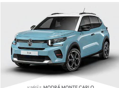
v sérii s MODRÁ MONTE CARLO