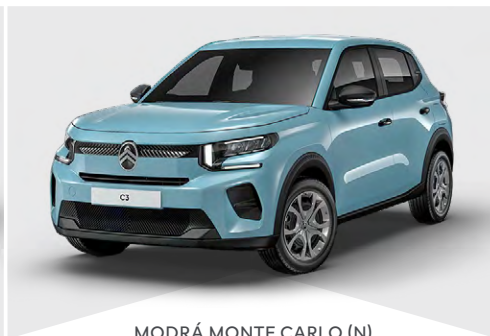
MODRÁ MONTE CARLO (N)