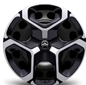
OKRASNÝ KRYT AZURITE 17"