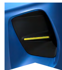
PRE MODRÚ BRIGHT