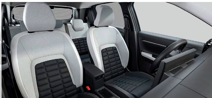
Látkový poťah čierny Fabric / sivý TEP poťah Sedadlá Citroën Advanced Comfort Palubná doska a panely dverí s dekórom Siderite