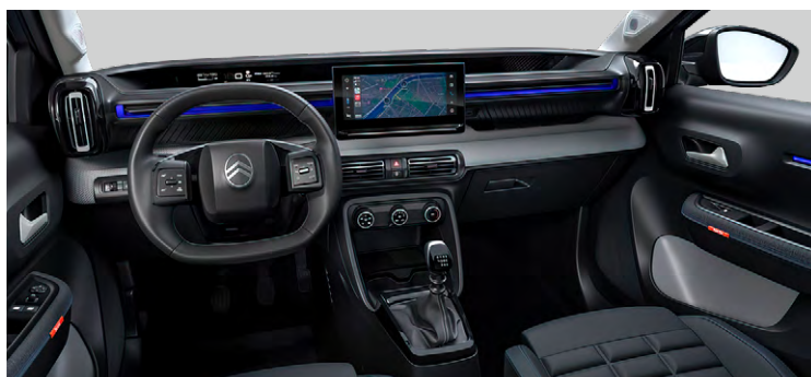
INTERIÉR URBAN GREY (NBFX)