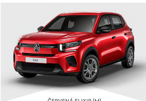
ČERVENÁ ELIXIR (M)