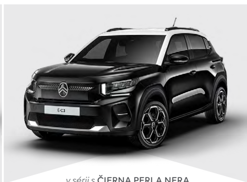
v sérii s ČIERNÁ PERLA NERA