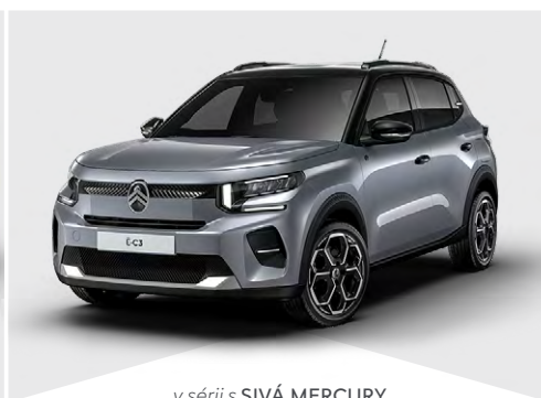
v sérii s SIVÁ MERCURY