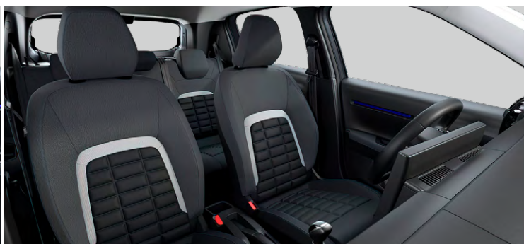
Látkový poťah čierny Fabric / tmavo sivý Asphalt Sedadlá Citroën Advanced Comfort Palubná doska a panely dverí s modrým dekórom