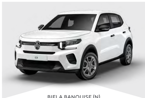
BIELA BANQUISE (N)