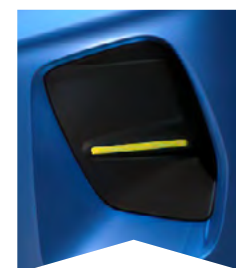
PRE MODRÚ BRIGHT