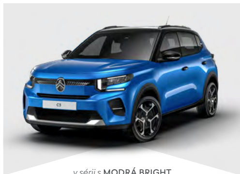
v sérii s MODRÁ BRIGHT