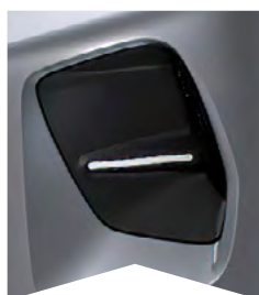
PRE SIVÚ MERCURY