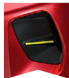
PRE ČERVENÚ ELEXIR