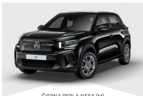
ČIERNÁ PERLA NERA (M)