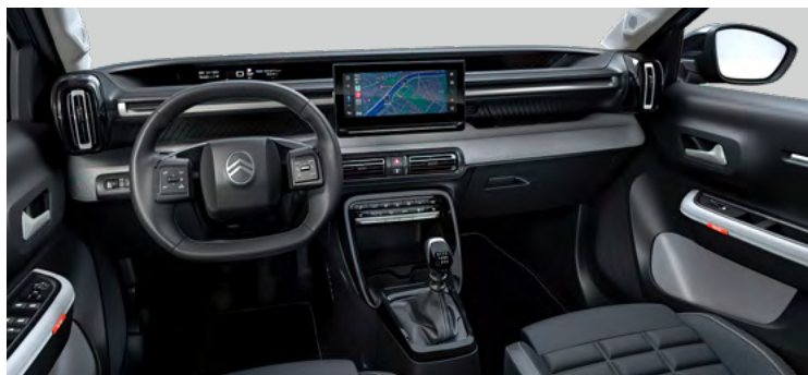
INTERIÉR METROPOLITAN GREY (NHFX)