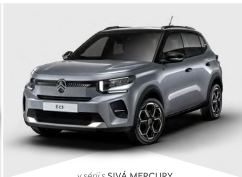
v sérii s SIVÁ MERCURY