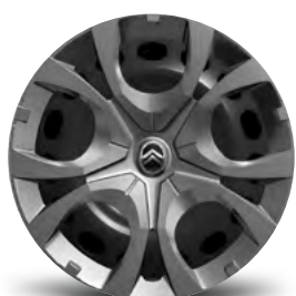
OKRASNÝ KRYT PYRITE 16"