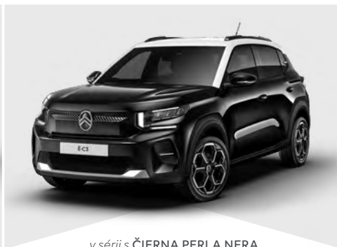
v sérii s ČIERNÁ PERLA NERA

Je možné zvoliť aj jednofarebnú karosériu (okrem modrá MONTE CARLO a MODRÁ BRIGHT).