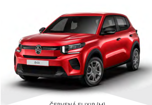
ČERVENÁ ELIXIR (M)