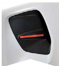
PRE BIELU BANQUISE