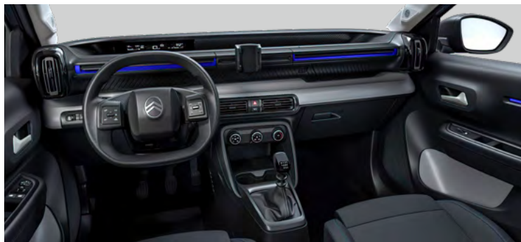
LÁTKOVÝ POŤAH ČIERNOSIVÝ (NAFX)