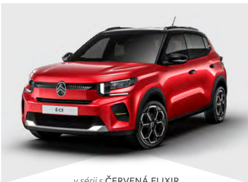
v sérii s ČERVENÁ ELIXIR