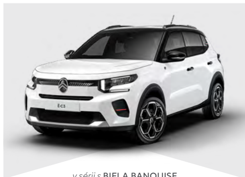
v sérii s BIELA BANQUISE