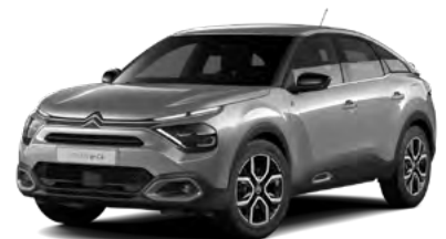
PACK COLOR GLOSSY SILVER