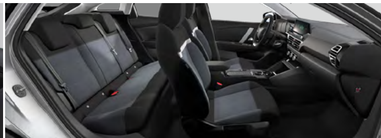
ŠTANDARDNÝ INTERIÉR (PRE YOU!)