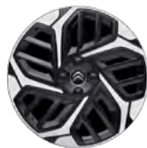
DISK Z LAHKEJ ZLIATINY 18" CAMELIA DIAMANTÉE