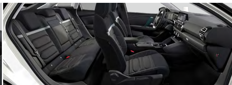
INTERIÉR ALCANTARA GREY