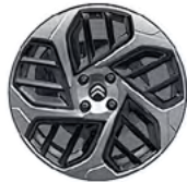
DISK Z LAHKEJ ZLIATINY 18" CAMELIA