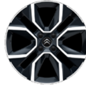
DISK Z LAHKEJ ZLIATINY 18" HANOY