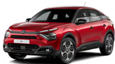
PACK COLOR GLOSSY BLACK