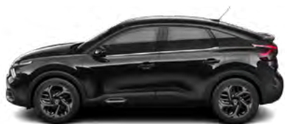
ČIERNÁ PERLA NERA (M)