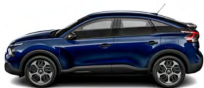
MODRÁ ECLIPSE (M)