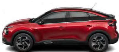
ČERVENÁ ELIXIR (P)

(M) – metalická farba karosérie, (P) – perleťová farba