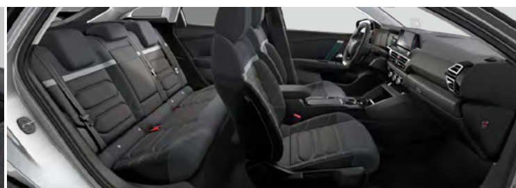
INTERIÉR METROPOLITAN GREY (V SÉRII PRE MAX)