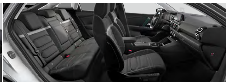
INTERIÉR HYPE BLACK