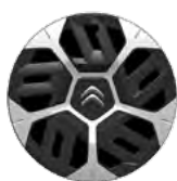
OKRASNÝ KRYT 18" AEROTHECH