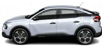
BIELA OKENITE (M)