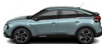
MODRÁ ICELAND (M) (1)