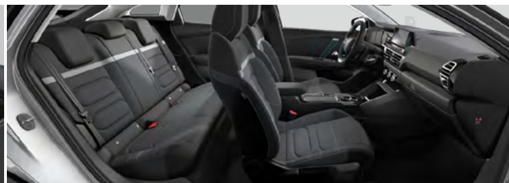
INTERIÉR URBAN GREY (V SÉRII PRE PLUS)