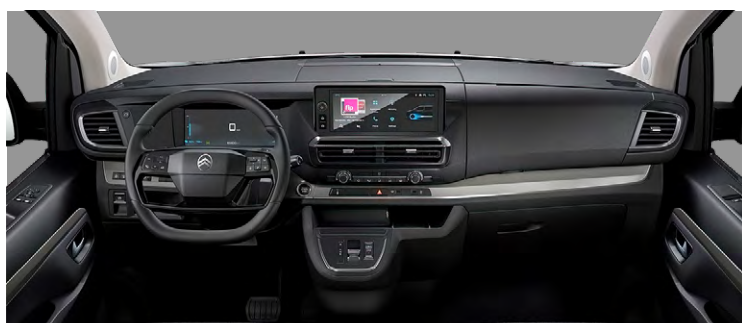
SPACETOURER BUSINESS + PACK FAMILY