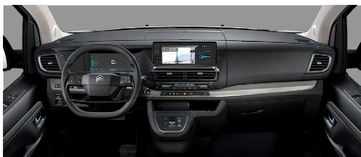
SPACETOURER BUSINESS LOUNGE