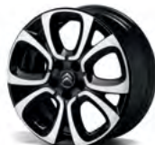
DISK KOLIES Z ĽAHKEJ ZLIATINY 17" PONTEVEDRA ČIERNE DIAMANTOVANIE