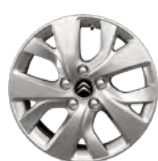
DISK KOLIES Z ĽAHKEJ ZLIATINY 16" NOTOS