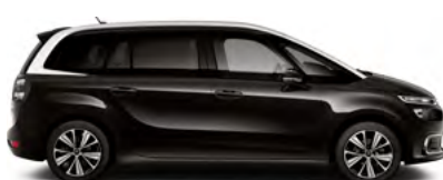
ČIERNA PERLA NERA (M)