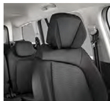
LÁTKOVÉ ČALÚNENIE FINN ČIERNA/KOŽA SIVÁ