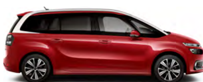
ČERVENÁ RUBI (M)