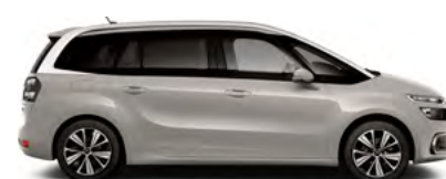
BÉŽOVÁ SABLE (M)