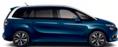
ALCHEMY MODRÁ (M)