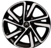
DISK KOLIES Z ĽAHKEJ ZLIATINY 17" SHAMAL