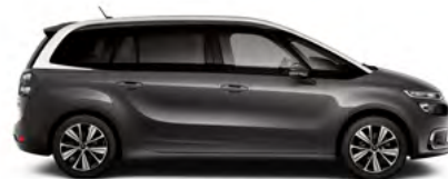
SIVÁ PLATINIUM (M)