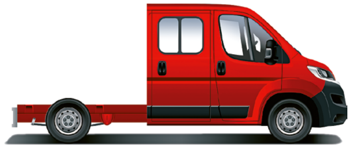
Citroën Jumper Šasi – dvojitá kabína.

Ďalšie informácie o vozidle nájdete na stránke www.citroen.sk , alebo sa obráťte na vášho najbližšieho predajcu CITROËN. C Automobil Import, s. r. o., si vyhradzuje právo meniť ceny a výbavu vozidiel bez predchádzajúceho upozornenia. Obrázok vozidla je ilustračný. Všetky ceny uvádzané v akciovom cenníku sú platné v prípade registrácie vozidla kupujúcim v členských štátoch Európskej únie (EU), štátoch Európskeho hospodárskeho priestoru (EHP) a vo Švajčiarsku, ktorú kupujúci riadne preukáže predávajúcemu predložením kópie príslušného osvedčenia o evidencii vozidla najneskôr v posledný deň kalendárneho mesiaca, v ktorom bolo vozidlo prevzaté zákazníkom. V prípade nesplnenia uvedených podmienok platia ceny a príplatky uvádzané v základnom cenníku. Použitie akciového cenníka je vylúčené aj v prípade špekulatívneho konania, najmä účelovej registrácie alebo zmeny registrácie vozidla. Viac informácií poskytne autorizovaný predajca na vyžiadanie.