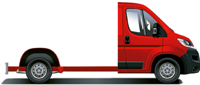
Citroën Jumper Šasi – jednoduchá kabína.