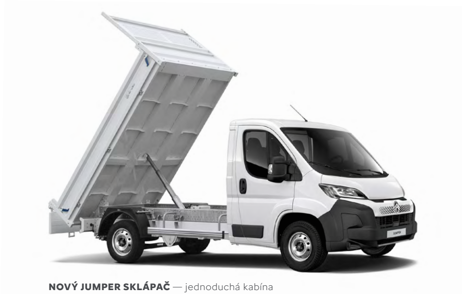
NOVÝ JUMPER SKLÁPAČ — jednoduchá kabína