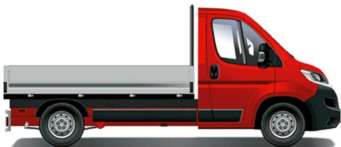
Citroën Jumper valník – jednoduchá kabína