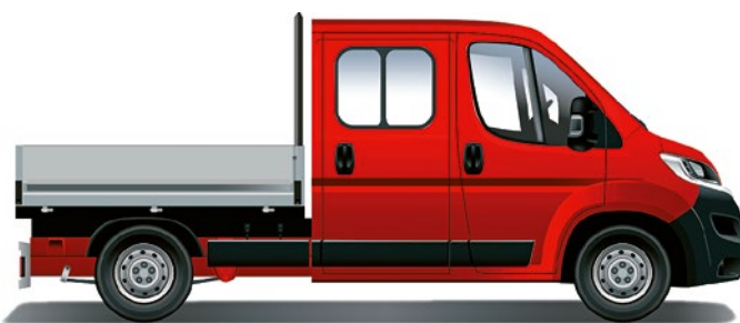
Citroën Jumper valník – dvojitá kabína