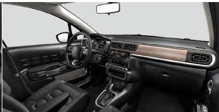
TECHWOOD — príplatkový (MAX)