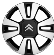
Disk MATRIX 16"