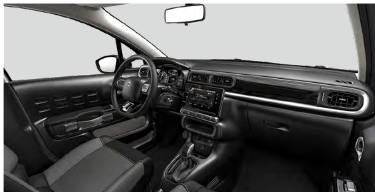
Sériový — YOU! / MAX