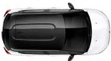
Čierna PERLA NERA