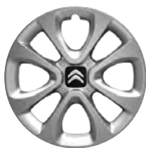
Okrasný kryt ARROW 15"